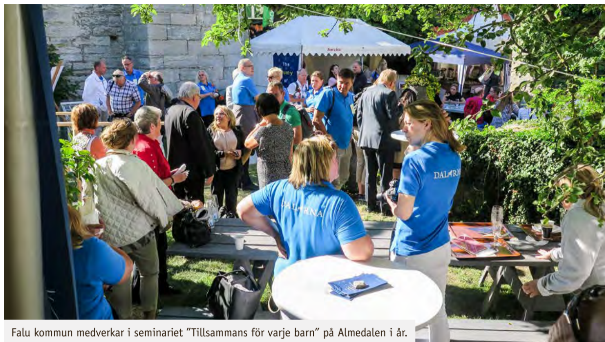
Falun kommun medverkar i seminariet "Tillsammans för varje barn" på Almedalen i år.

Flera av seminarierna sänds på webben, se www.falun.se för aktuellt program.