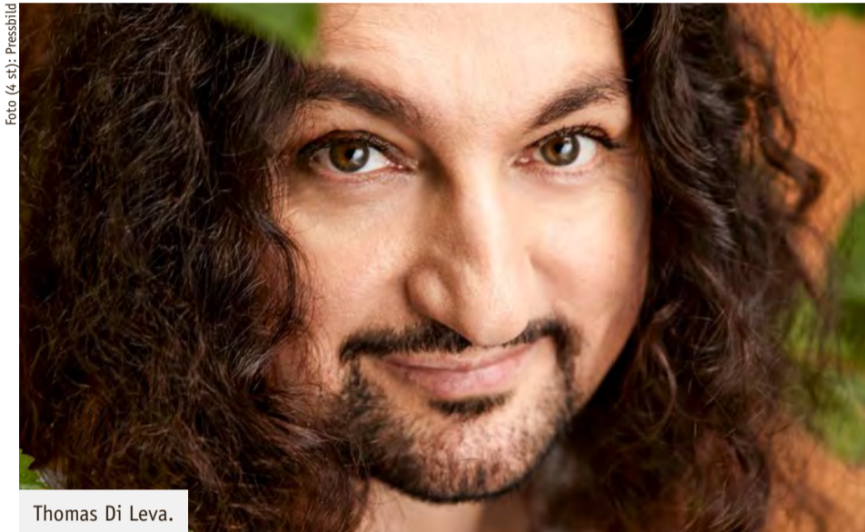
Thomas Di Leva.