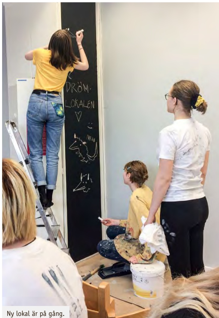
Ny lokal är på gång.

Läs mer på kommunens hemsida, www.falun.se eller ring Falu kommuns kontaktcenter, telefon 023-830 00. ■