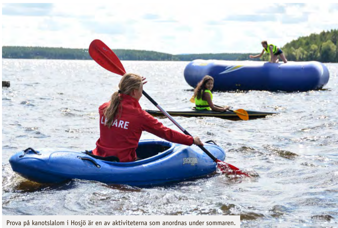
Prova på kanotslalom i Hosjö är en av aktiviteterna som anordnas under sommaren.

– Alla barn har rätt till ett roligt sommarlov och det känns kul att kunna erbjuda så