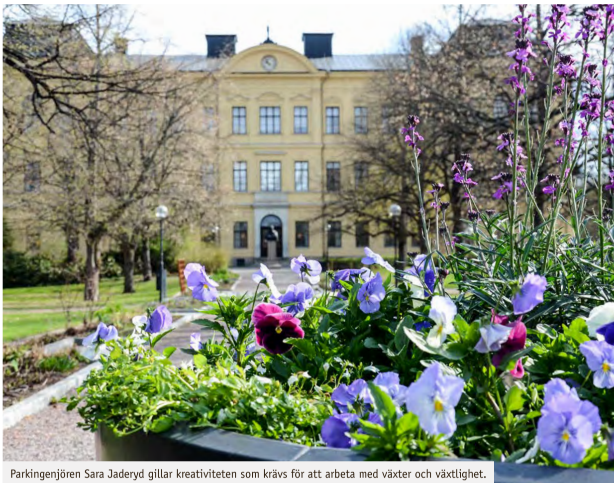
Parkingenjören Sara Jaderyd gillar kreativiteten som krävs för att arbeta med växter och växtlighet.