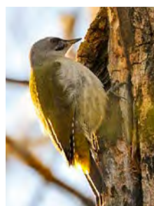
Gråspett är en av alla fågelarter du kan få se i naturreservaten.

I ett naturreservat gäller, utöver allemansrätten, även särskilda föreskrifter eller regler. Varje reservat är unikt med egna föreskrifter anpassade efter områdets förutsättningar. Läs mer om naturreservaten i Falun på www.falun.se ■