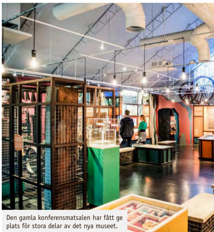
Den gamla konferensmatsalen har fått ge plats för stora delar av det nya museet.

givetvis berättelsen om Falu gruvans tillkomst till att den lades ner 2001, som presenteras på ett kronologiskt sätt.