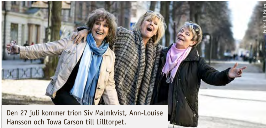
Den 27 juli kommer trion Siv Malmkvist, Ann-Louise Hansson och Towa Carson till Lilltorpet.