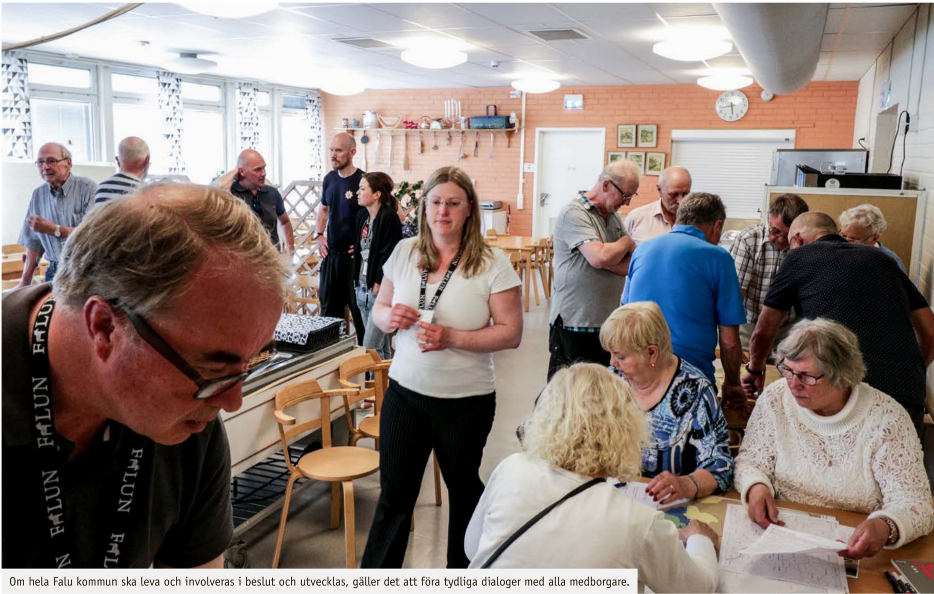
Om hela Falu kommun ska leva och involveras i beslut och utvecklas, gäller det att föra tydliga dialoger med alla medborgare.