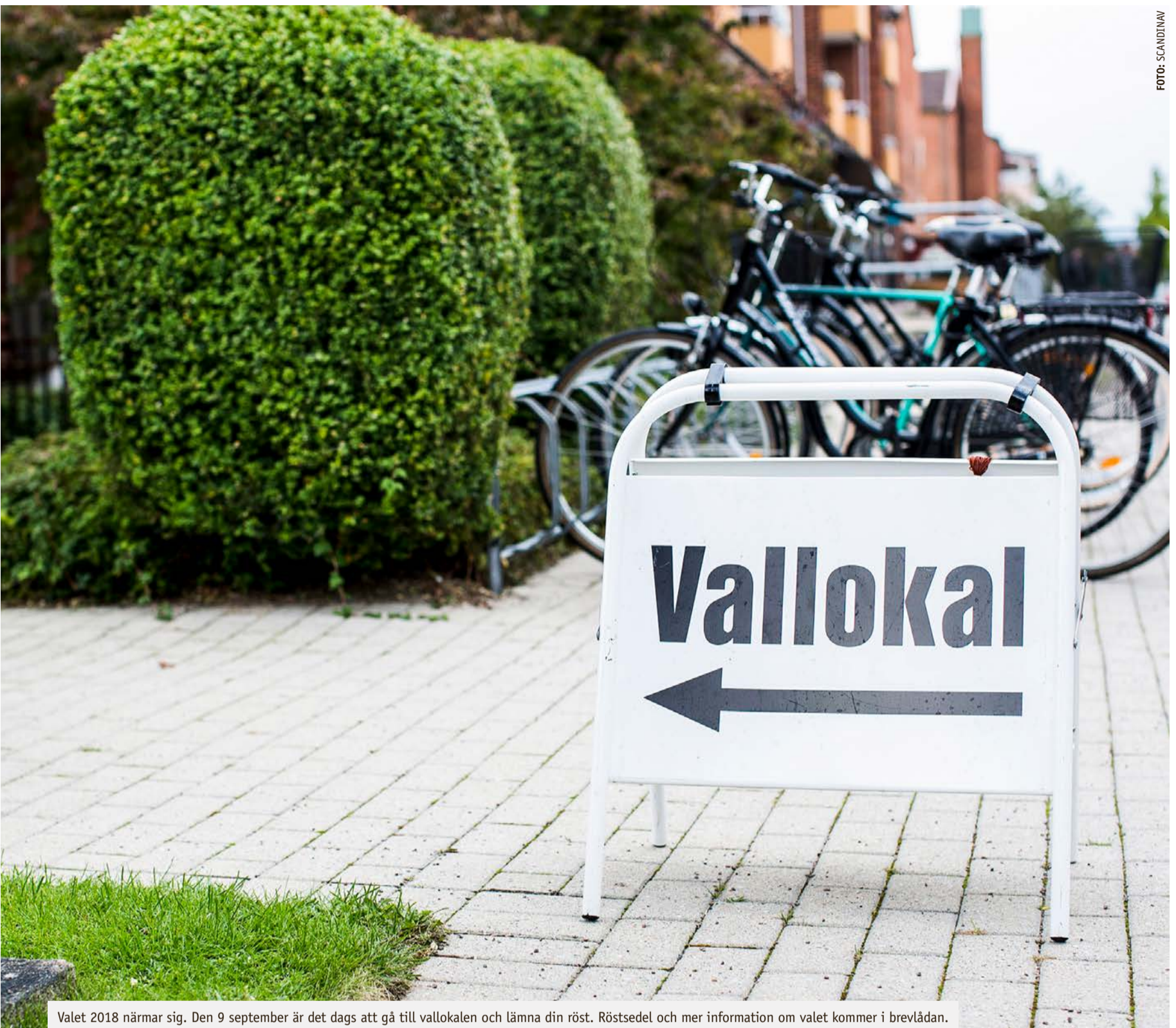
Valet 2018 närmar sig. Den 9 september är det dags att gå till vallokalen och lämna din röst. Röstsedel och mer information om valet kommer i brevlådan.

demokratins betydelse. Behovet av att prata om hur vårt samhälle ser ut, fungerar och ska fungera i framtiden är stort. Så det här valet kommer bli annorlunda än tidigare val – både i vad människor grundar sitt val på men även på hur mobilisering inför valet kommer att se