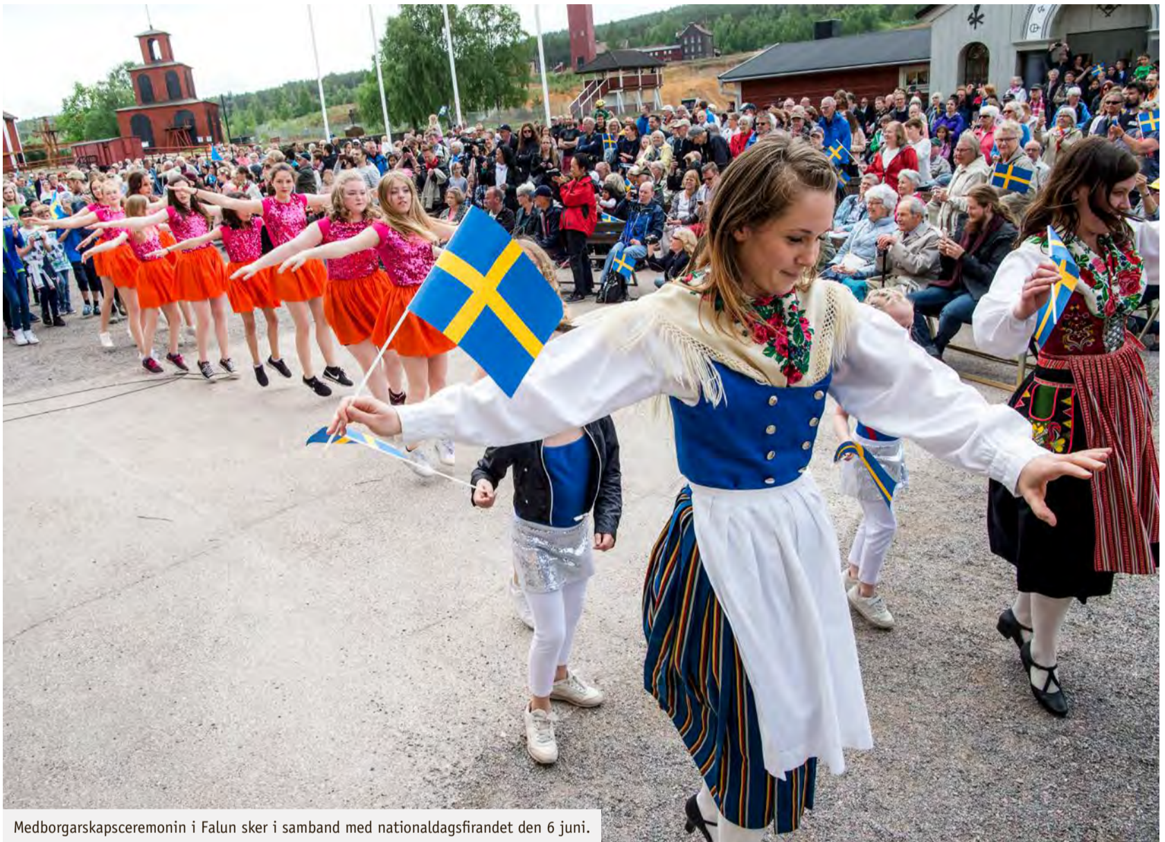
Medborgarskapsceremonin i Falun sker i samband med nationaldagsfirandet den 6 juni.