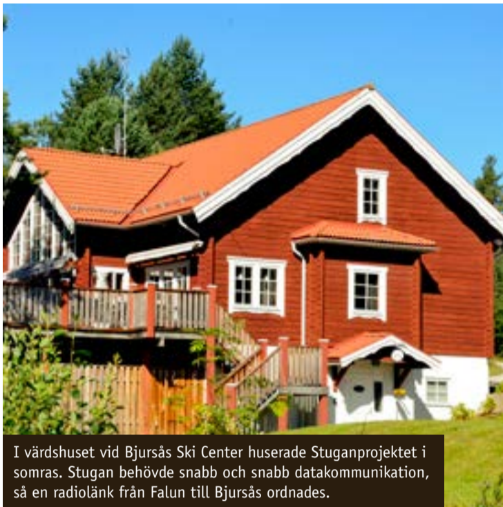
I vårdshuset vid Bjursås Ski Center huserade Stuganprojektet i somras. Stugan behövde snabb och snabb datakommunikation, så en radiolänk från Falun till Bjursås ordnades.