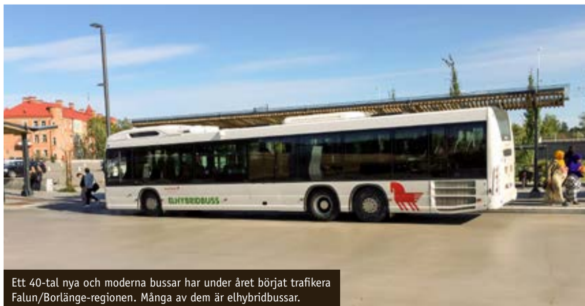
Ett 40-tal nya och moderna bussar har under året börjat trafikera Falun/Borlänge-regionen. Många av dem är elhybridbussar.