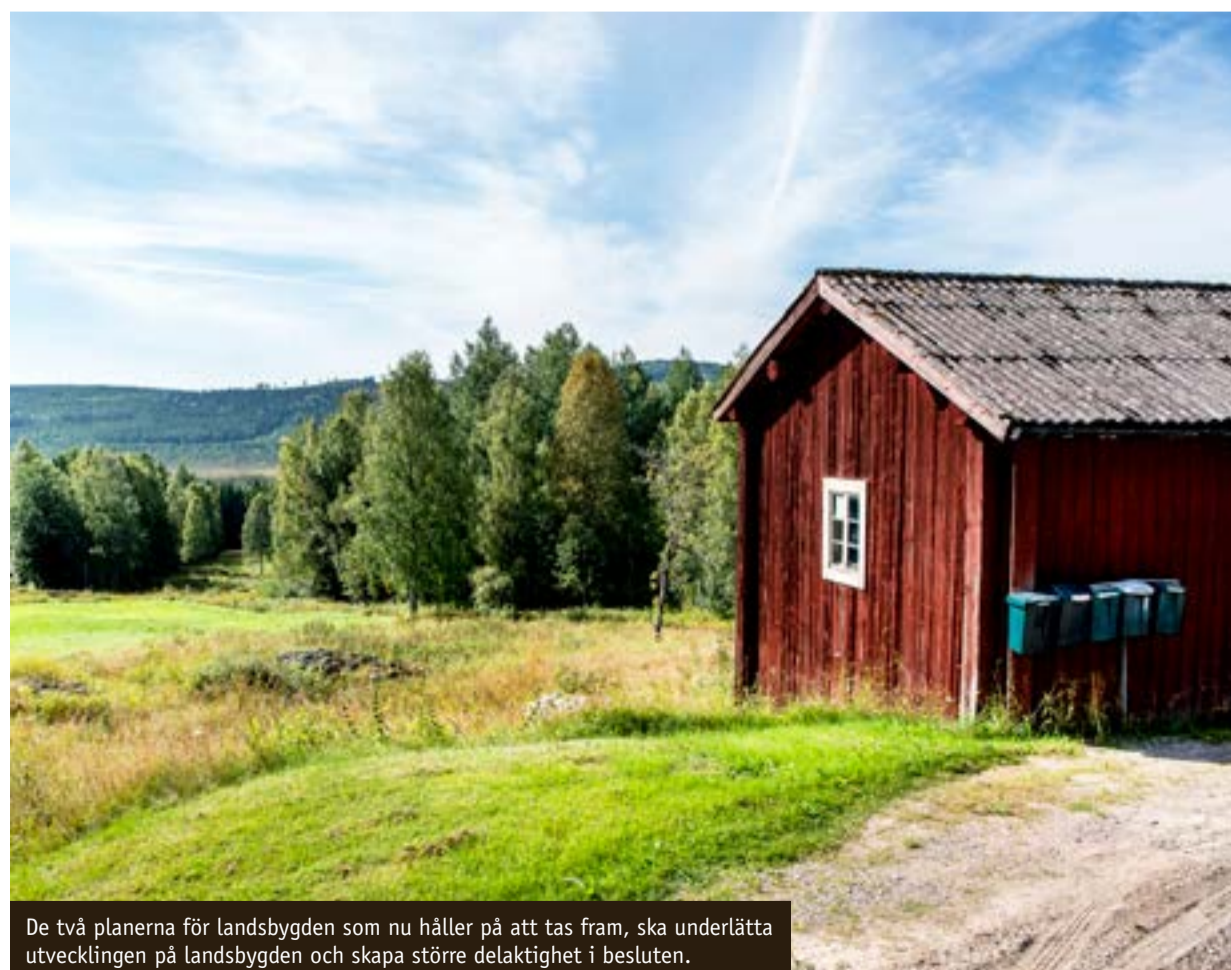
De två planerna för landsbygden som nu håller på att tas fram, ska underlätta utvecklingen på landsbygden och skapa större delaktighet i besluten.

där kan du också se en karta med företag som är med i kampanjen.