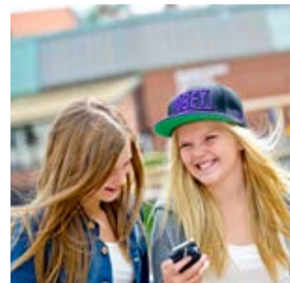
Arkivbild. Personerna på bilden har inget direkt samband med artikeln.