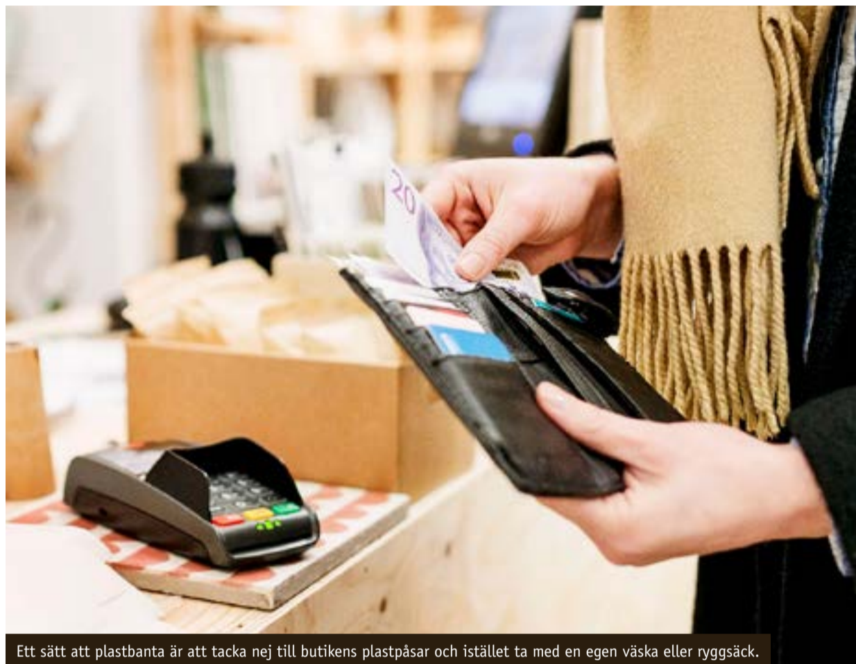
Ett sätt att plastbanta är att tacka nej till butikens plastpåsar och istället ta med en egen väska eller ryggsäck.